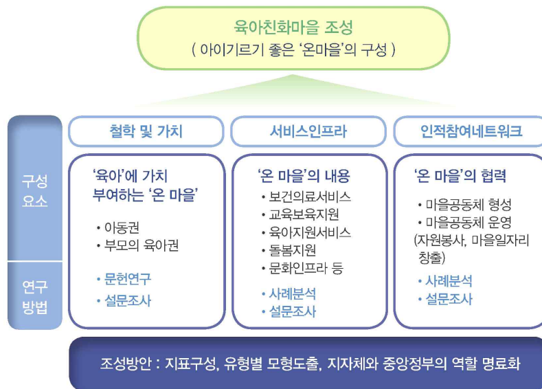
[그림 1] 육아친화마을 조성방안 연구모형