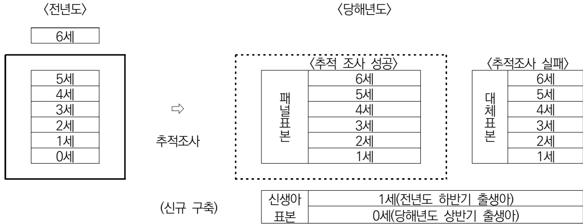
[그림 3] KICCE 소비실태조사 표본 추적 및 추가 방식

주: 1) 굵은 점선은 추적 대상 표본 가구를 의미하며(전년도 6세를 추적 대상 표본에서 제외), 굵은 점선은 추적 조사에 성공한 표본의 당해년도 연령을 의미. 2) 표본의 연령은 가구의 막내 자녀 연령을 기준으로 함.